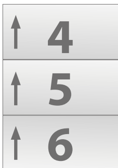
Układ ulotki po złożeniu