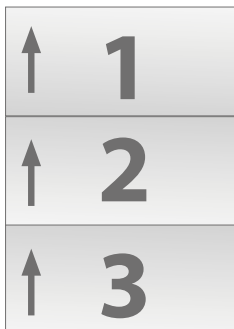
Układ stron wewnętrznych