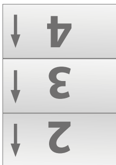
Układ ulotki po złożeniu